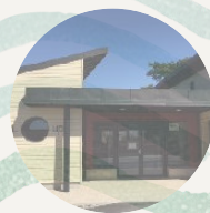
Les P'tits Loups

Toute l'actualité du service Petite Enfance sur www.entrebeauceetperche.fr